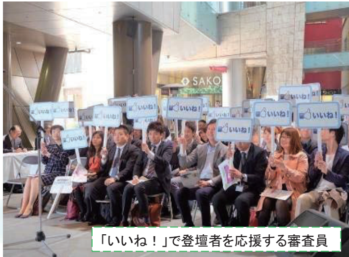
「いいね！」で登壇者を応援する審査員