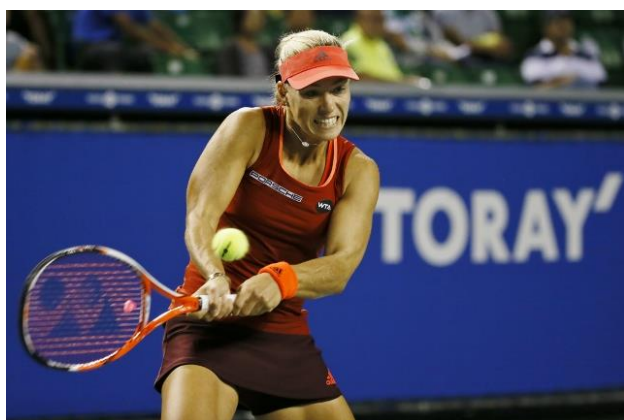
2015年大会でのアンゲリク・ケルバー選手