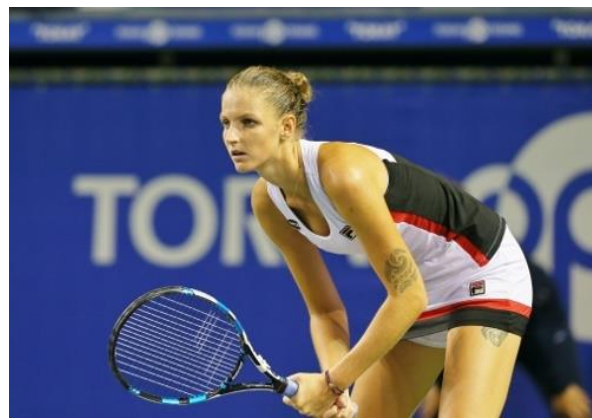
昨年大会でのカロリナ・プリスコバ選手