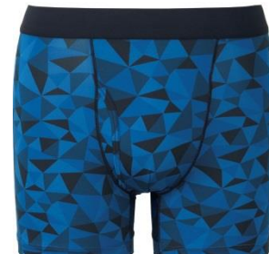
エアリズムボクサーブリーフ (ジオメトリック) ¥990+消費税