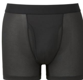
エアリズムメッシュボクサーブリーフ ¥990+消費税