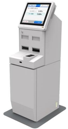
開発中のマルチ 電子マネーチャージ機

2. 多彩な決済方法に対応するクラウド型決済プラットフォーム「シンカクラウド」の構築・拡販 クラウド型決済プラットフォーム「Thincacloud/シンカクラウド」を構築し、拡販を進めています。決済時の暗号処理などをクラウド側に寄せることで決済端末の機能を最小限に抑えることができ、スマートフォンなども決済端末として利用できるため店頭決済のみならず、屋外での移動販売やインターネットショッピングなどにも利用可能で、電子マネー決済の裾野を広げることができます。またシンカクラウドはチャージ（入金）の機能も備え、株式会社 PFU が開発中の各種主要電子マネーのチャージが1台で可能な電子マネー業界初*のマルチチャージ機のサービスインフラに採用されています。