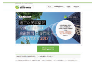
WEBサイトからお申し込みください