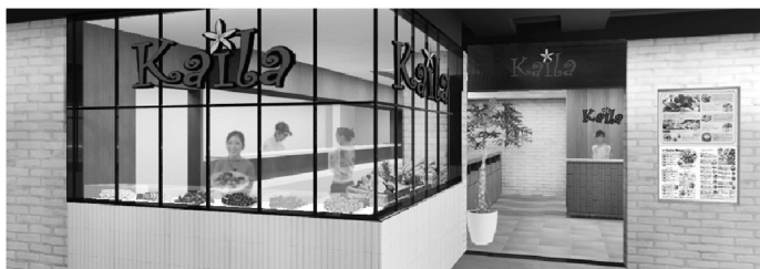
カイルならではの新鮮なフルーツがたっぷり並んだキッチン!