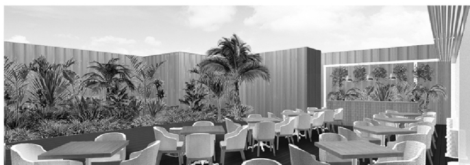
広いテラス席では、毎週2回のフライイベントも開催!