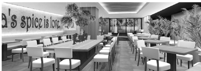
広々とした店内で、渋谷にしながらハワイを感じて頂けます!