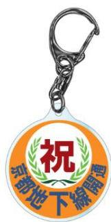
京阪電車オリジナルキーホルダー（イメージ）