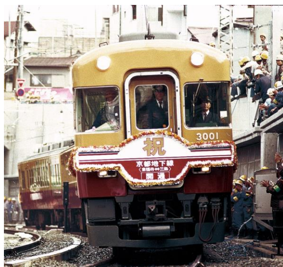
京都地下線開通当時の様子