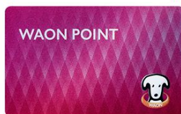
WAON POINT ご提示