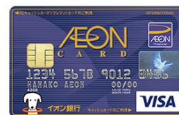
イオンカード ご提示およびお支払い