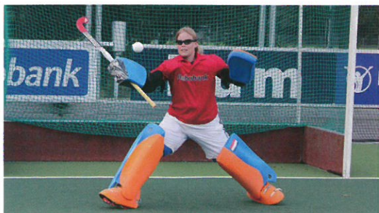
※オランダ・フィールドホッケー1部リーグ所属の3チーム20名によるテスト 3ヵ月トレーニングの前後で8種類のフィールドテストを実施 各チームの専属オプトメトリストが視覚能力を測定