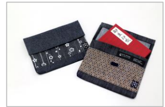
オリジナル御朱印帳袋