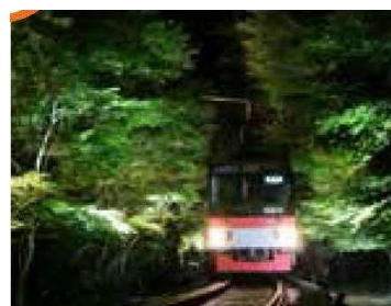
叡山電車・もみじのトンネル (市原～二ノ瀬駅間)