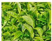
茶葉ポリフェノール ※5 (チャ葉エキス)