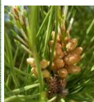
ポリフェノール ※3 (マツエキス/チャエキス)