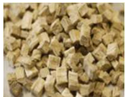
カコンイソフラボン (カコンエキス)