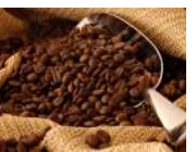
コーヒーポリフェノール (コーヒー種子エキス)