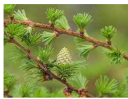
松ポリフェノール ※5 (マツエキス)