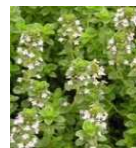
タイム、マジョラム、 ※5 スパイクラベンダー