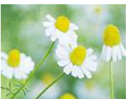
カモミールポリフェノール (カモミラエキス)