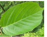
サクラポリフェノール ※5 (サクラ葉エキス)