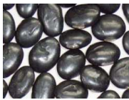
ダイズイソフラボン (加水分解黒豆エキス)