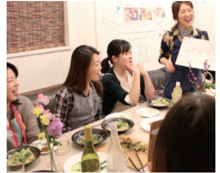
にぎやかな食卓グッズ