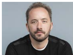
ベン・ホロウィッツ Andreessen Horowitz 共同創業者兼ゼネラルパートナー

世界で 5 億人を超えるユーザー数を誇る人気オンラインストレージサービス、Dropbox の CEO であり共同創業者。