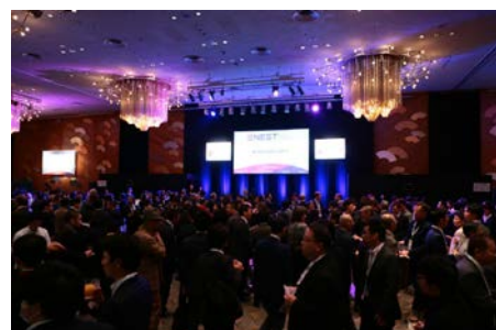
昨年開催（新経済サミット 2016）時の様子

会期中は、ベストセラー『Hard Things』の著者ベン・ホロウィッツ氏や、世界中で5億人を超えるユーザー数を誇る人気オンラインストレージ「Dropbox」共同創業者のドリュー・ヒューストン氏、そして「世界で最もイノベティブな会社」に選ばれた世界的なデザインファーム IDEO のパートナーであるトム・ケリー氏らによる基調講演を始め、グローバルなイノベーション分野の第一線で変革をけん引するリーダー達によるパネルディスカッションが開催されます。