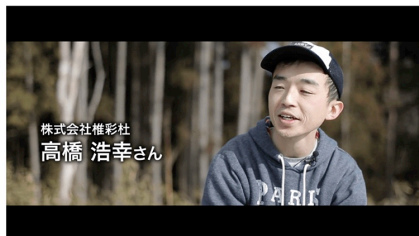
PR 動画「駅すばモール×南三陸『未来に向けて』」の一部カット（1）

東日本大震災の被災地のひとつ、宮城県・南三陸地域では、2017年3月3日（金）より飲食や鮮魚、理美容などの店が28店舗集まる「南三陸さんさん商店街」がオープンされました。