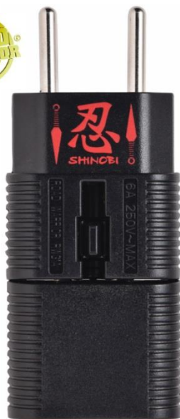
RWG01 無駄を省いた超小型設計