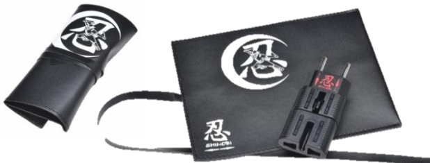
RWG01C 遊び心のある「忍び袋付」バージョン