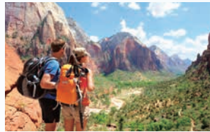
登山やアウトドアに