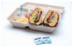
手を使うお食事に(おにぎり・ハンバーガー・サンドイッチ)