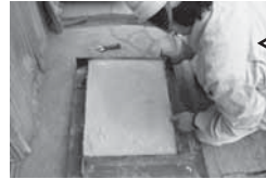
② コンクリートを打設。脱型