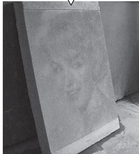
【コンクリートに転写】