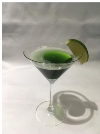
茶の香ギムレット