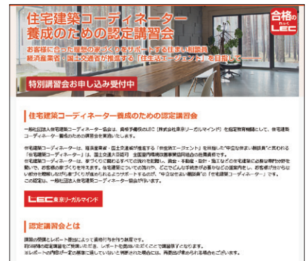
LEC東京リーガルマインドウェブサイト