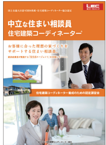
住宅建築コーディネーター資格案内表紙

資格者は約1,800名(2016年12月現在)を全国に輩出しています。最近の取得者は建築・不動産系従事者に加え、保険やファイナンシャルプランナー、住宅相談店従業者にまで広がりを見せています。JKC協会では、この新制度により資格取得し易くなったことで、2017年12月までに新規認定登録者数2,000名を見込んでいます。