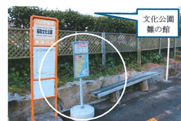
13. 稲取文化公園雑の館前