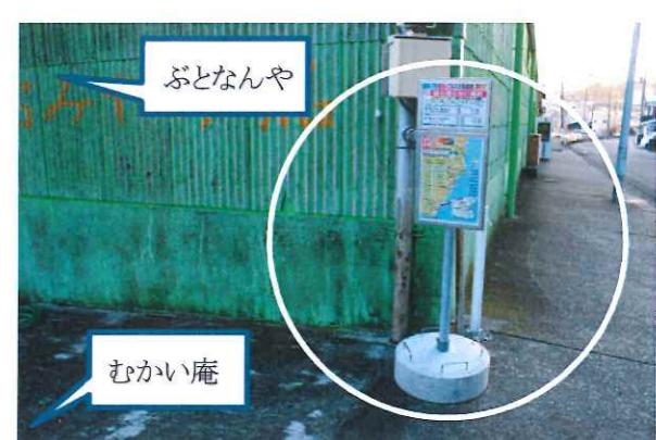
10. 雑の館むかい庵前