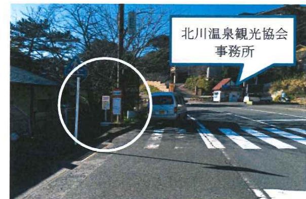
3. 北川黒根岩風呂前