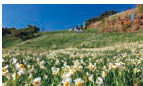
爪木崎水仙まつり [期間：12月20日～2月10日]