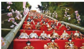
第5回伊東MAGARI雛 [期間：2月24日～3月5日]