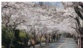
伊豆高原桜まつり [期間：3月中旬～4月上旬]