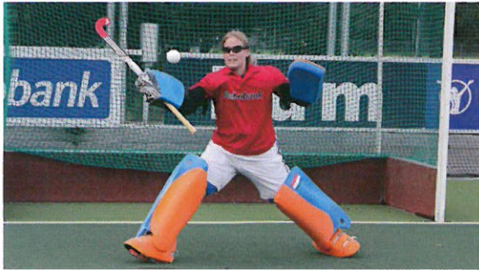
※オランダ・フィールドホッケー1部リーグ所属の3チーム20名によるテスト 3か月トレーニングの前後で8種類のフィールドテストを実施 各チームの専属オプトメトリストが視覚能力を測定