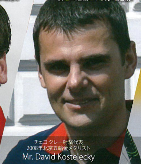
チェコ クレー射撃代表 2008年北京五輪金メダリスト Mr. David Kostelecky