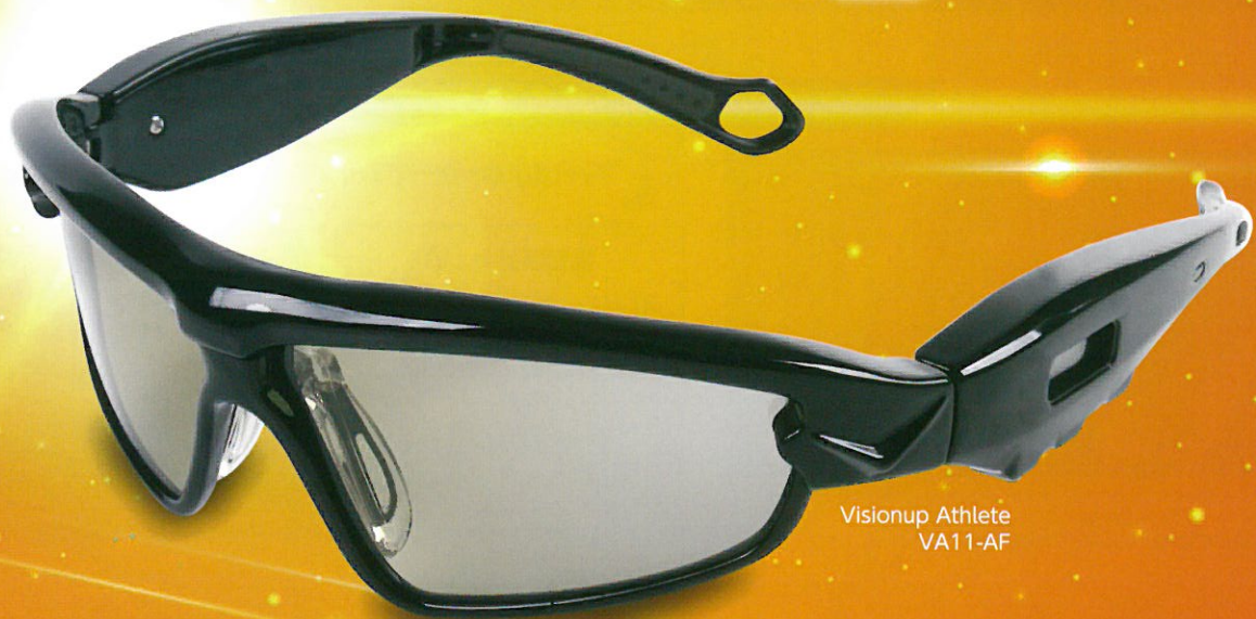
Visionup Athlete VA11-AF

1回 15分 + 週 3回 + 3ヵ月 で 見る判断動作 集中力 予測力 = パフォーマンスUP