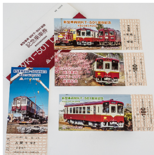
「駅すばモール」で販売する「絶版 わ鐵記念切符セット」