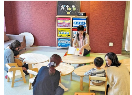
▲ブックレクの様子