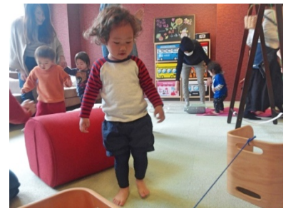
▲ボディレクの様子