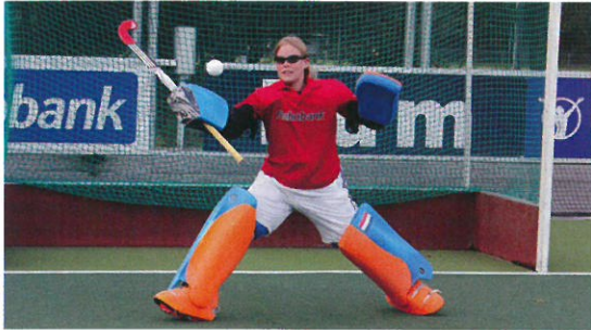
※オランダ・フィールドホッケー1部リーグ所属の3チーム20名によるテスト 3か月トレーニングの前後で8種類のフィールドテストを実施 各チームの専属オプトメトリストが視覚能力を測定