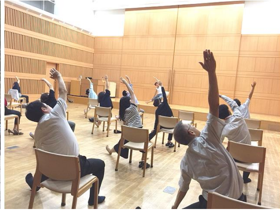
平成 28 年度から新たな取り組みとして オフィスヨガを実施