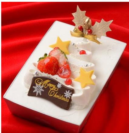
クリスマスツリーをイメージした キュートなレアチーズケーキ

(18cm×12cm/約2～3人用) 2980円 ※スイーツフォレスト限定 ※30台限定