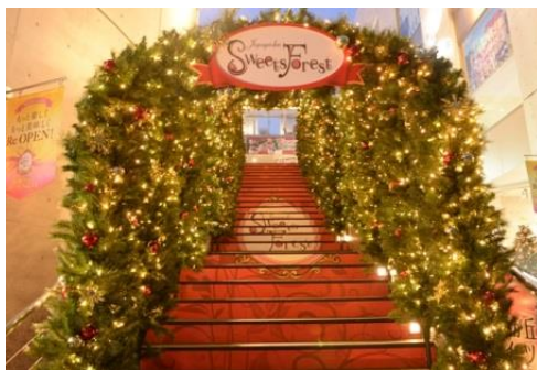
(上)クリスマスイルミネーション・トンネル (画像は2015年)

オブジェディスプレイース(1階)やパーク内のクリスマスディスプレイに加え、フォトプロップスなどクリスマスグッズ貸出無料サービスなども今年もフォトスポットとしても存分nお楽しみいただけます。