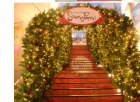
クリスマスイルミネーション トンネル(2015年)