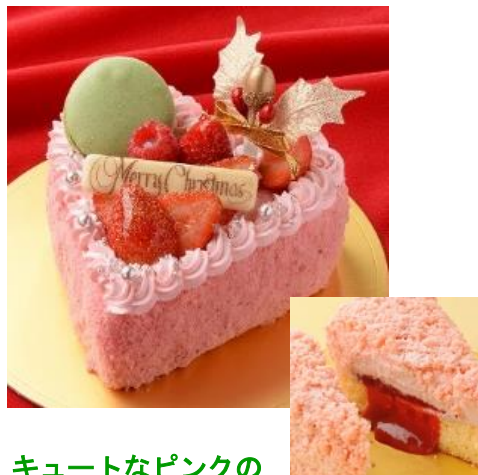
キュートなピンクの ハートのとろけるチーズケーキ

(直径12cm/約2～3人用) 2680円 ※スイーツフォレスト限定 ※50台限定