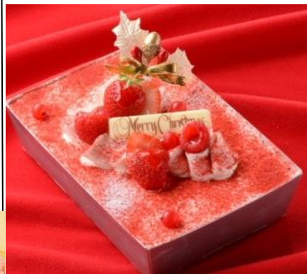
手ごろなサイズで楽しめる、 オリジナル苺ティラミス

(18cm×12cm/約2～3人用) 2580円 ※スイーツフォレスト限定 ※50台限定