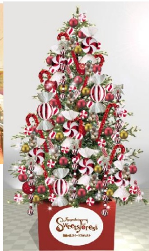
(右)クリスマスツリー(イメージ)