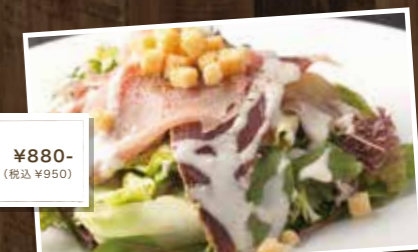
Raw Ham Caesar Salad