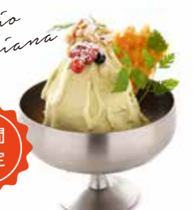
5270 ピスタチオイタリアーナ