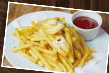
Cheese Potato Fries