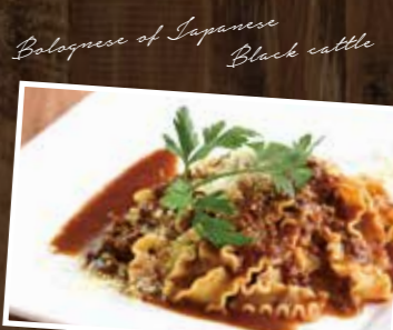
Bolognese of Japanese Black cattle