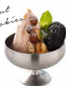
5268 ヘーゼルナッツ & クッキー