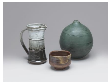
島岡 達三「掛合釉象嵌縄文ピッチャー」(左) 金重 道明「備前茶盃」(中) 浅見 隆三「緑釉壺」(右)

会期 12月8日(木)～14日(水) ※最終日は17時閉場 内容 年末恒例の陶芸市を今年も開催いたします。今回は近現代の有名作家、実力作家の逸品約70点を展示販売します。名品の滑らかな曲線、すらりと伸びた直線の優美で華麗な世界。伝統と現代が共存する名品の数々を取り揃えました。