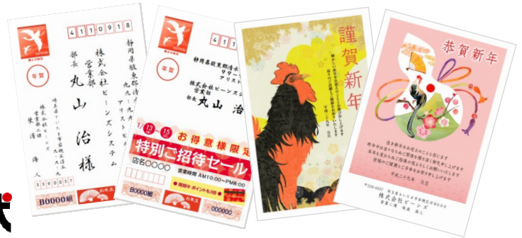
年賀状のデザインは、完成イメージです。 実際に納品・投函されるものとは異なります。