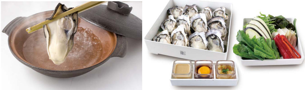
* 旬の真牡蠣と季節の野菜(写真は2名様分)

ゼネラル・オイスターでご提供している生牡蠣はすべて、富山湾 384メートルから取水した入善の海洋深層水で 48 時間かけて浄化をしております。海洋深層水は特徴のひとつに「富栄養性」があり、ミネラルが豊富に含まれています。その“海からの自然の恵み”をそのまま、しゃぶしゃぶの出汁に生かしました。