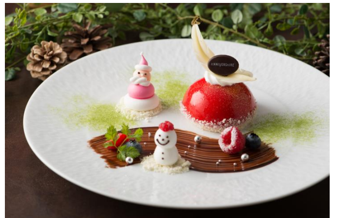
アニヴェルセル・ルージュ

低温のオーブンで長時間かけてローストし、しっとり焼き上げたサーロインを、肉の旨みを存分に感じていただくために、厚めにスライスして提供します。甘味とコクのある赤ワインソースと、甘酸っぱいラズベリーソース組み合わせが至福の美味しさです。