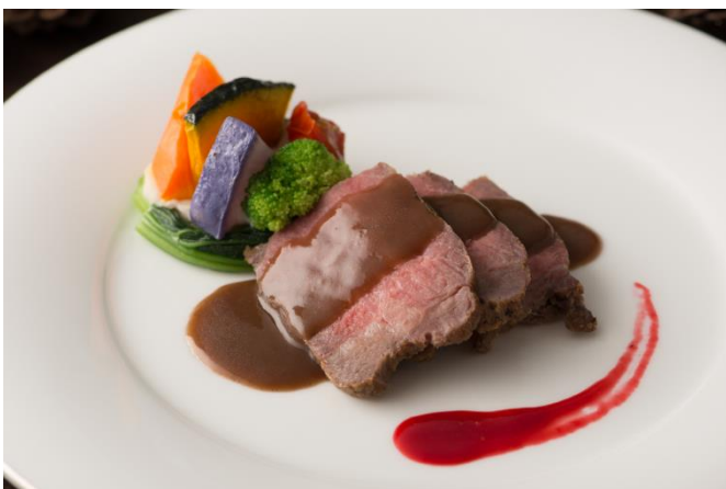
牛サーロインのロースト～旬の野菜添え～

海老と魚の旨味が凝縮した、ハーブの香り豊かなあっさりトマトソースパスタ。ミンチにした海老と魚のコクがやみつきになる1品です。2人でシェアしてお召し上がりください。※写真は2名分