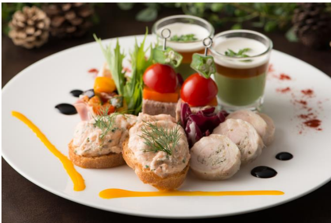
5種の前菜クリスマスプレート

聖夜の始まりにふさわしい、シェアスタイルの色鮮やかなオードブルの盛り合わせ。様々な味わいと食感が1皿で楽しめます。(1:ラタトゥイユ 生ハム包み/2:牛肉のパテと野菜のピンチョス/3:野菜のムースとコンソメのジュレ/4:冷製鶏もも肉のルーロ/5:サーモンのリエット) ※写真は2名分