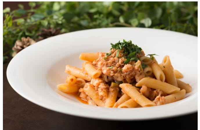
“ペスカトーラ”漁師風 魚と海老のトマトソース

聖夜の始まりにふさわしい、シェアスタイルの色鮮やかなオードブルの盛り合わせ。様々な味わいと食感が1皿で楽しめます。(1:ラタトゥイユ 生ハム包み/2:牛肉のパテと野菜のピンチョス/3:野菜のムースとコンソメのジュレ/4:冷製鶏もも肉のルーロ/5:サーモンのリエット) ※写真は2名分