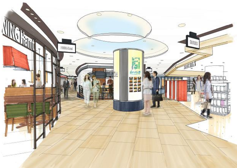
▲「パナンテ京阪天満橋」(リニューアルイメージ)