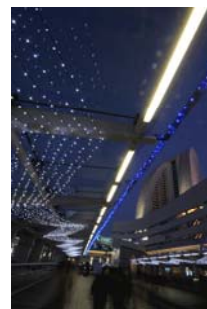
クイーンモール橋