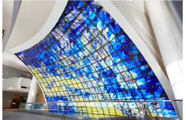
国立大ホール ステンドグラス

平山郁夫画伯による原画を元にデザインされました。国立大ホールがオープンした1994年の開港記念日(6月2日)に横浜上空に見える星座を配置し、壮大な星の神話、ギリシャ神話の世界を描いています。