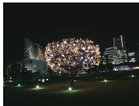
臨港パーク芝生広場 「光のイルミネーションツリー」