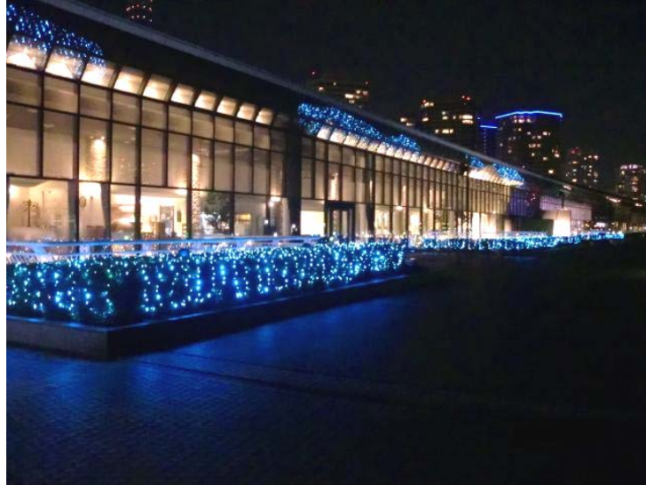
展示ホール 2F 海側デッキ

また、国立大ホールでは、スタンドグラスの一般開放も予定されています。大切な方とロマンティックにお過ごしいただけます。