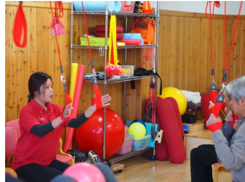
Red Cord : 重力を除いた状態で様々な運動・動作の練習が可能