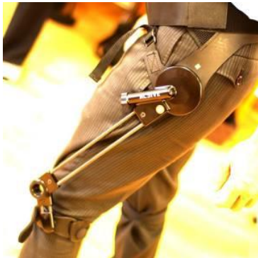
無動力歩行支援機アクシブ : 脳梗塞などで振り出しが上手くいかない方にオススメ