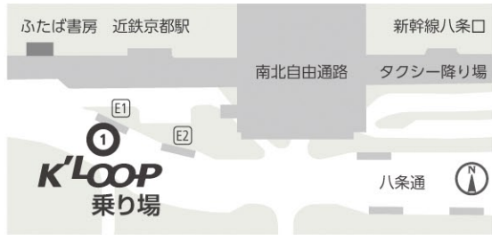
ルート図 Bus Route