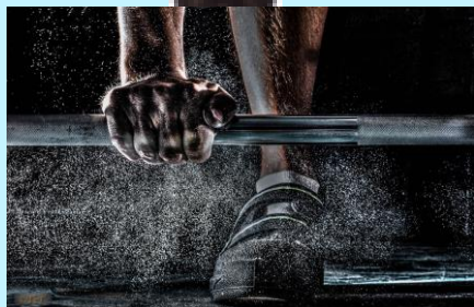
くすぐり軽量あげ