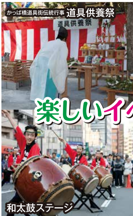
かつば橋道具街伝統行事 道具供養祭