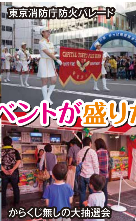
東京消防庁防火パレード