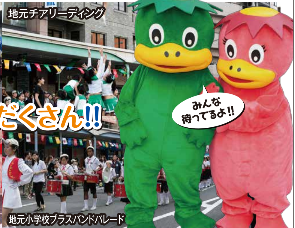
地元チアリーディング