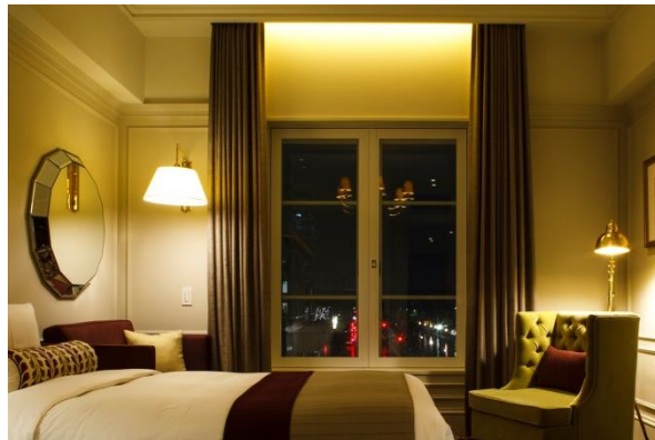
客室イメージ (パレスサイドスーベリアツイン)

東京駅丸の内駅舎の中に位置する東京ステーションホテル(所在地:東京都千代田区丸の内 1-9-1)では、〈共に喜びをわかちあうクリスマス〉をテーマに「Share the Joy of Christmas 2016」と題して、心弾むフェスティブシーズンにおすすめの宿泊プランやレストランプロモーション、チャリティ企画をお届けいたします。