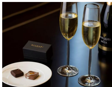
特典の「ブルガリ」チョコレートとスパークリングワイン

この報道資料は、ときわクラブ、丸の内記者クラブ、JR記者クラブにご案内しています。 クリスマスのレストランプロモーションとチャリティ企画は、10月に報道資料にてお送りいたします。