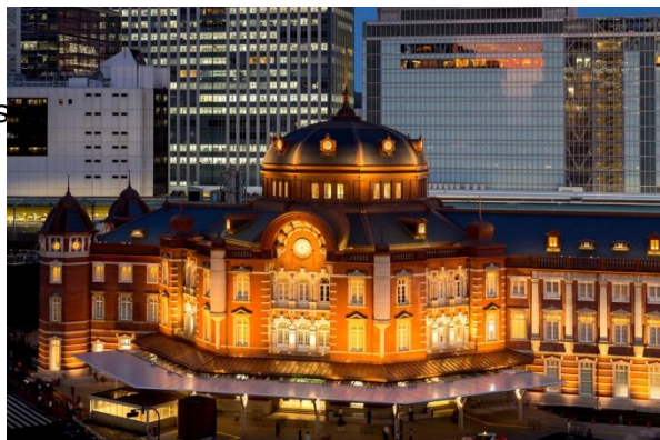
ホテルが位置する東京駅丸の内駅舎