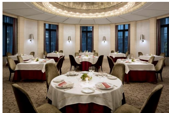
大人のクリスマスを過ごせる、レストラン (ブランドージュ)