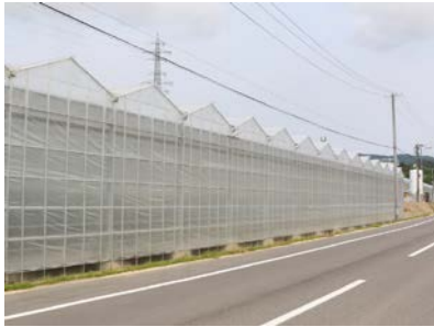
JR とまとランドいわきファーム

JR とまとランドいわきファームは、日照時間が長く「サンシャインシティ」とも呼ばれている福島県いわき市にある太陽光利用型植物工場で、太陽光を活用して最適な栽培環境をつくることができます。そのため、おいしいとまとを安定的に生産し出荷することが可能です。今回は実がしっかりしていて、加工しやすく味が良い大玉の品種「リンカ 409」と「富丸ムーチョ」を使用しています。