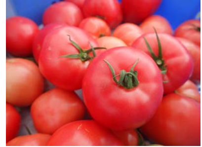
実際に収穫されたとまと