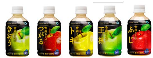
--- 青森りんごシリーズ（2015 年 10 月～2016 年 9 月に発売した商品） ---

2010 年より毎年発売している青森りんごシリーズは、ストレート果汁 100%・密閉搾り製法を採用しており、お客さまより大変好評をいただいております。これまで、青森県産のりんごのみを使用した商品を中心に販売してきましたが、今回は JR とまとランドいわきファームで生産された福島県産とまとをブレンドした「果実・野菜ミックスジュース」として新たな価値を提案します。また、ブレンドの割合を検証し、りんご：とまと=9：1 にすることで、とまとの味をしっかりと感じられる味わいとなりました。原材料は青森県産りんごと福島県産とまとのみで、酸化防止剤（ビタミン C）不使用の飲料です。