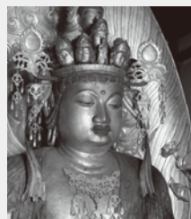
重要文化財 十一面観音菩薩坐像(滋賀・櫛野寺蔵)

本館 特別5室 2016年9月13日(火)～2016年12月11日(日) 野外シネマ当日は、特別展も22:00まで開催します。滋賀県・櫛野寺(らくやじ)に伝わる重要文化財の平安時代の仏像20体すべてを寺外で展示する初めての展覧会です。本尊の十一面観音菩薩坐像は像高が3mもある圧巻の作品で、普段は大きく重い扉に閉ざされている秘仏です。そのほかにも2.2mある薬師如来坐像など平安彫刻の傑作を一時にご覧いただけます。