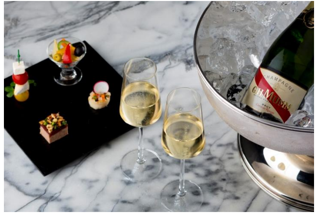
〈ロビーラウンジ〉のラ スイート

東京駅丸の内駅舎の中に位置する東京ステーションホテル(所在地:東京都千代田区丸の内 1-9-1)では、2016年11月2日(水)のホテル開業記念日を祝し、日頃ご愛顧くださっている多くのお客様に感謝を込めて、「ホテル開業 101 周年記念プロモーション」を開催いたします。