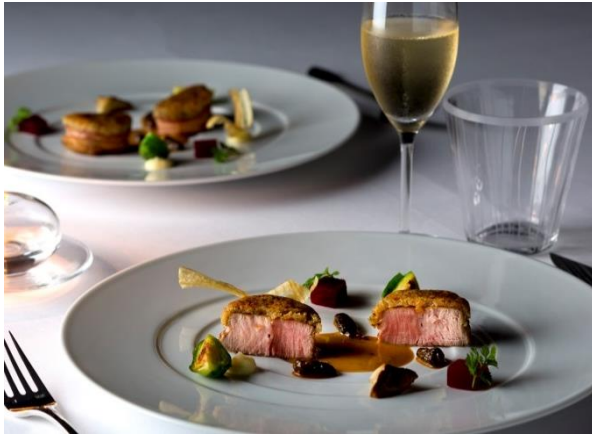
〈グラン ルージュ〉のシャンパーニュで和味