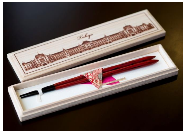
東京駅限定ギフトの漆箸 (桐箱入り)