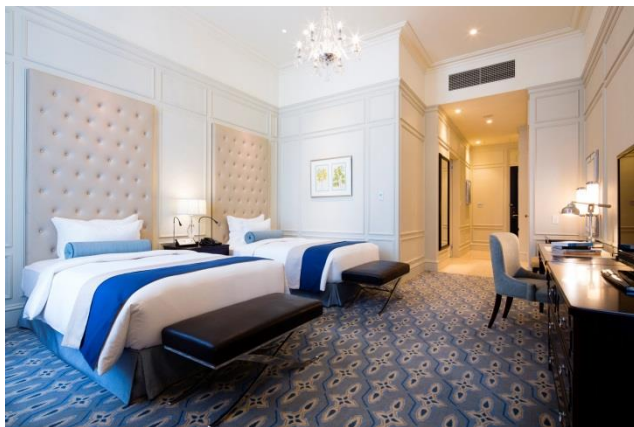
ジュニアスイート