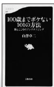
100歳までボケない101の方法 一冊とこころのアンチエイジング (文芸春秋)