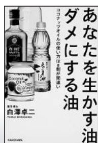
あなたを生かす油がダメにする油 (KADOKAWA)