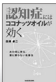
認知症にはココナッツオイルがきく (KADOKAWA)