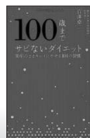
100歳までサビないダイエット 美肌のままキレイにやせる101の習慣 (ポプラ社)