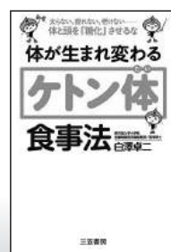
体が生まれ変わる「ケトン体」食事法 (三笠書房)