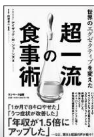
世界のエクゼクティブを変えた超一流の食事術 (サンマーク出版)