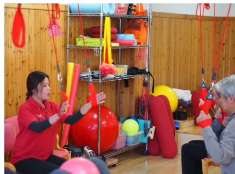
Red Cord：重力を除いた状態で様々な運動・動作の練習が可能