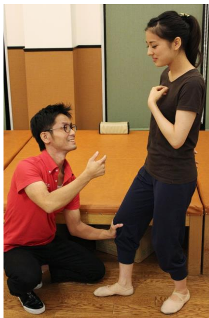
パーソナルトレーニングの様子