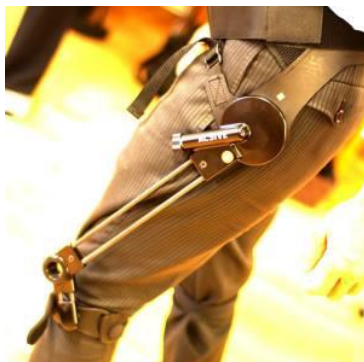
無動力歩行支援機アシスト：脳梗塞などで振り出しが上手くいかない方にオススメ