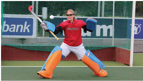
※オランダ・フィールドホッケー1部リーグ所属の3チーム20名によるテスト 3か月トレーニングの前後で8種類のフィールドテストを実施 各チームの専属オプトメトリストが視覚能力を測定