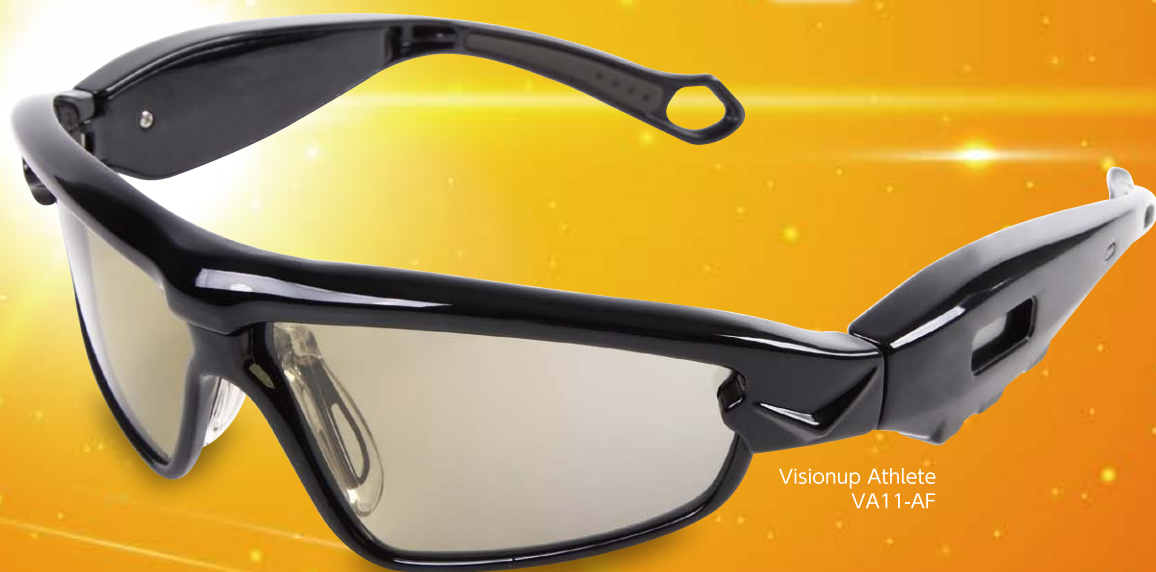
Visionup Athlete VA11-AF

1回 15分 + 週 3回 + 3か月 で 見る判断動作 集中力 予測力 = パフォーマンスUP