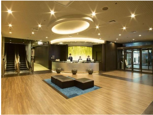
ホテル京阪 京都 グランデ ロビー