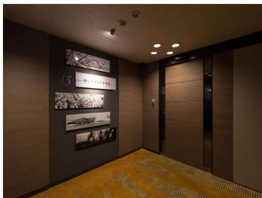
ホテル京阪 京橋 グランデ スーベリアフロア