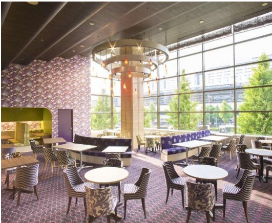
ホテル京阪 京都 グランデ レストラン「OCTAVAR」