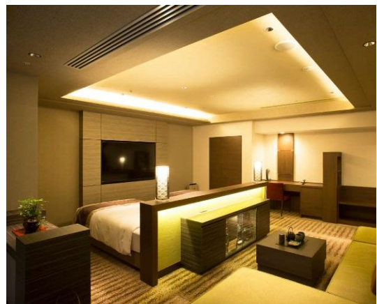
ホテル京阪 京都 グランデ 「禅」スイート