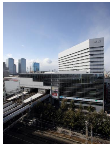
新たに「ホテル京阪グランデ」ブランドを導入する ホテル京阪京都（左）とホテル京阪京橋（右）