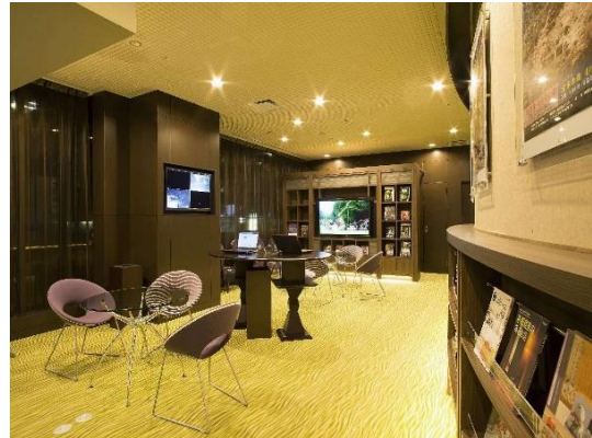
ホテル京阪 京都 グランデ 観光情報ライブラリー