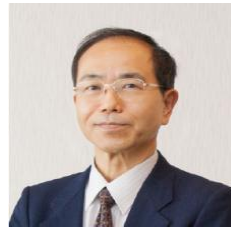
福岡 秀興(ひでおき) 早稲田大学 理工学術院 理工学研究所研究院教授