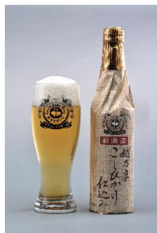
スワンレイクビール（新潟）

JR大阪城公園駅前広場という開放的な場所で、美味しいクラフトビールをとことん堪能。心地よい秋の季節を、大阪城公園の芝生や木陰で、ご友人・ご家族など皆様でお楽しみいただけます。