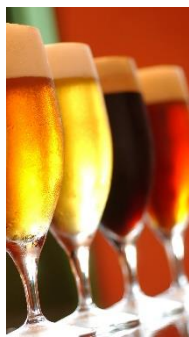
ハーヴェストムーン（千葉）