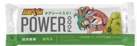
玉虫色の「頂上の蜘蛛男」・クライマー巻島裕介 抹茶風味 瞬発系バー