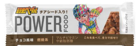
アキバ大好きのオタク少年・クライマー小野田坂道 チョコ風味 燃焼系バー