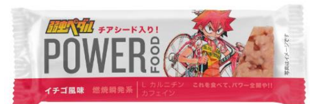
迅速のスピードマン・スプリンター鳴子章吉 イチゴ風味 燃焼瞬発系バー

弊社は、 大阪大学内に、ファインバイオサイエンス研究所(FBRC) を保有しており、 産学連携 にて、製品を自社で研究・開発、また、 自社工場にて製造 しております。今後もお客様によりよい製品をお届けできるよう、製品の研究・開発に積極的に取り組んでまいります。